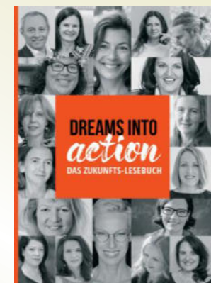
Co-Initiatorin, Autorin & Herausgeberin