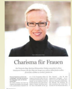
Personal Development Trainerin & Coach