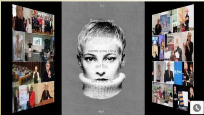
Career 1990 – 2018 Showreel